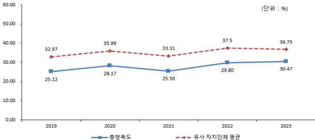
충청북도 - 유형평균 재정자립도(당초예산) 비교

☐ 재정자립도는 전년대비 0.67% 증가하였습니다. 이는 일반회계 기준 자체세입 예산이 167,404백만원(10.51%) 증가하였지만 중앙정부 이전재원 또한 282,979백만원(8.01%) 증가하여 전년도보다 다소 증가하였습니다. 우리 도는 유사자치단체 평균 재정자립도 36.75%보다 6.28%가 낮은 30.47%로 유사자치단체에 경기도(49.3%)가 포함되어 평균이 높게 나타나기 때문입니다.