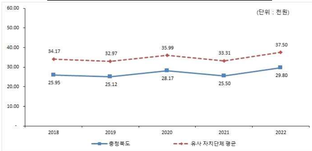
유형 지방자치단체와 재정자립도(당초예산) 비교

☐ 재정자립도는 전년대비 4.3% 증가하였습니다. 이는 일반회계 기준 자체세입 예산이 306,869백만원(23.9%) 증가한 반면 중앙정부 이전재원 47,532백만원(1.3%) 감소하였기 때문입니다. 우리도는 유사단체 평균 재정자립도 37.50% 보다 7.7%가 낮은 29.8%로 유사자치단체에 경기도(55.7%)가 포함되어 평균이 높게 나타나기 때문입니다.