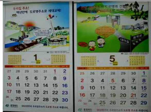
달력 제작 홍보