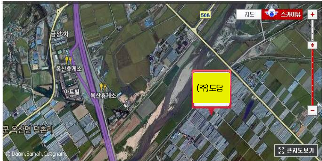
농업회사법인 도담(청주시 흥덕구 신촌동 423-3)