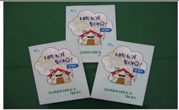
유아용 책자 발간