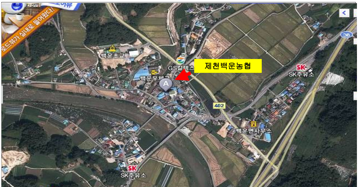
백운농업협동조합(제천시 백운면 평동리 223)