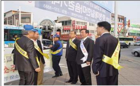
시민단체와 공동 가두 캠페인 전개